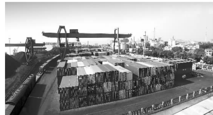
洞庭湖生态经济区全面融入长江经济带，已成为湖南新的经济增长极。图为岳阳城陵矶货场。

在绿色发展理念下，湖南长株潭两型社会建设深入推进，阶梯电价、水价、气价、排污权交易等一大批改革初见成效。节能减排成效明显，单位地区生产总值能耗累计下降19.9%，单位工业增加值用水量累计下降39.8%，主要污染物排放明显减少。森林覆盖率稳定在57%以上，主要江河Ⅲ类及更优水质达到92.9%。