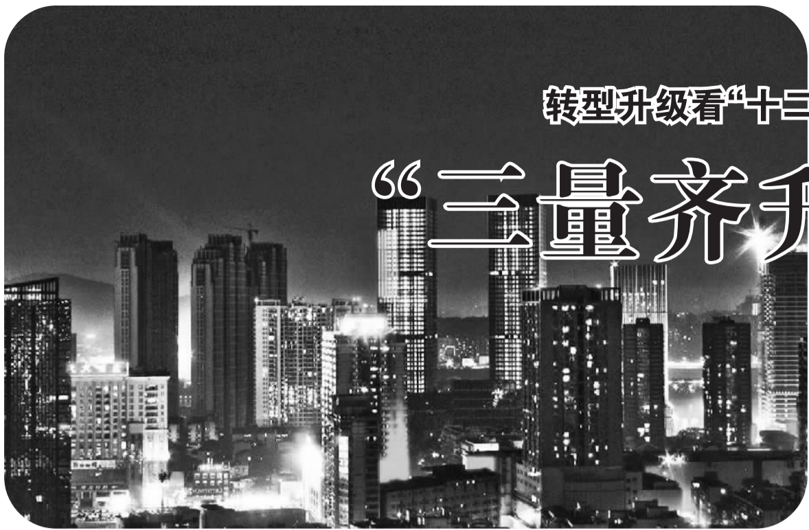
长株潭地区率先发展势头强劲，核心增长极的辐射带动作用进一步增强。图为长沙都市夜景。