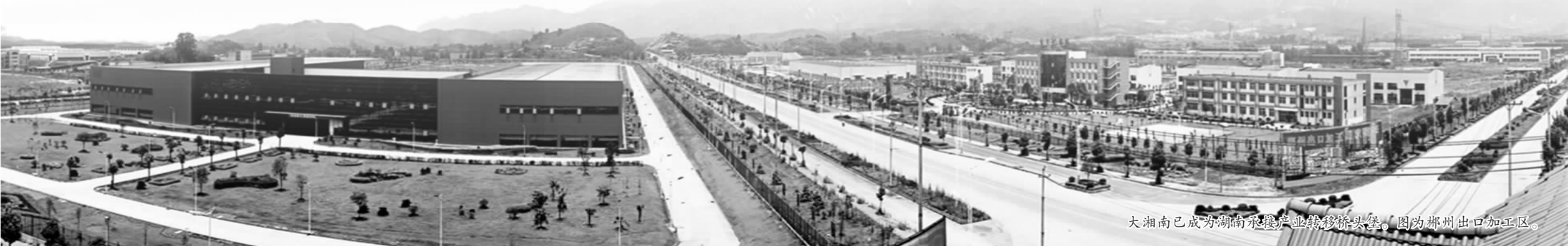
大湘南已成为湖南承接产业转移桥头堡。图为郴州出口加工区。