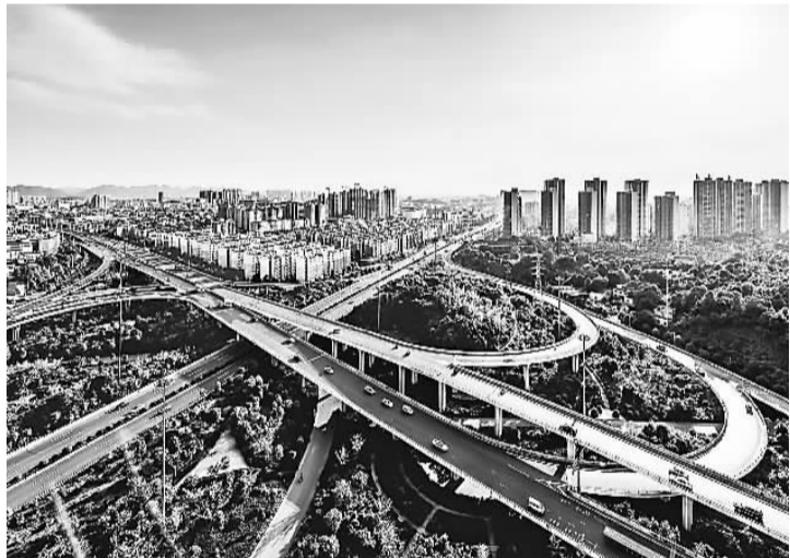
湖南交通四通八达。

经济实力的提升，吸引了世界资本对湖南的青睐。“十二五”期间，湖南新引进世界500强企业83家，总数达到137家，实际利用外商直接投资年均增长18.6%，实际引进内资年均增长17.5%，对外实际投资年均增长10%以上，一批优势企业成功“走出去”。岳阳、衡阳、湘潭综合保税区，郴州出口加工区等一批开放平台获批，内陆开放格局初步形成。