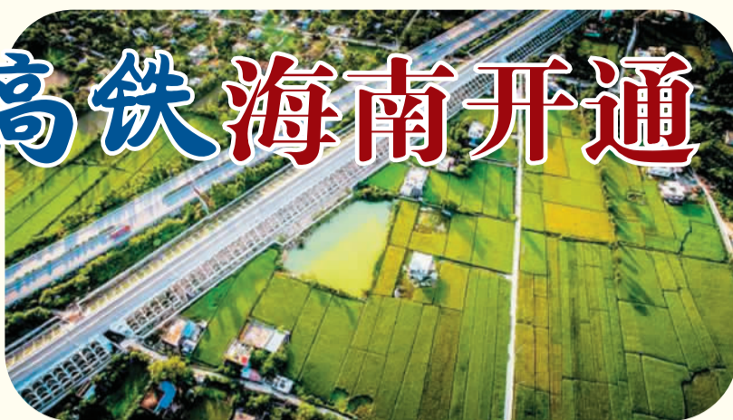
图为高铁经过西部原野

“坐上高铁去环岛”，海南人民百年高铁梦想今朝终于实现！2015年12月30日，海南西环高铁正式开通运营。西环高铁的建成通车与东环高铁形成闭环，标志着全球首条环岛高速铁路在海南诞生，海南迈入环岛高铁时代。这条环绕东西、贯通南北的交通大动脉承载着乡情、承载着海南发展的希望，将海南融入“一带一路”并助力国际旅游岛迅速腾飞。