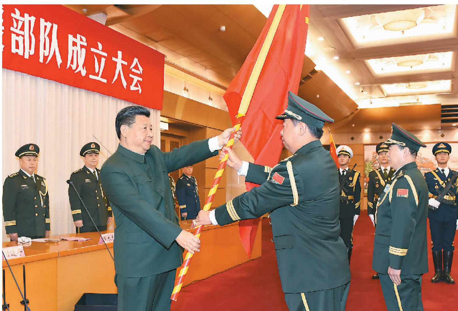
图为习近平将军旗郑重授予陆军司令员李作成、政治委员刘雷。