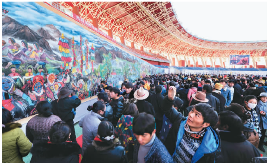
开幕当天，上千拉萨民众观展。