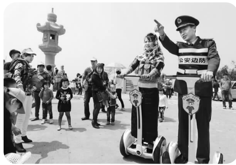
方便快捷的平衡巡逻车

晋江“鞋博会”、石狮“海博会”、石狮蚶江“海上水节”“全国沙滩排球巡回赛（晋江站）”等