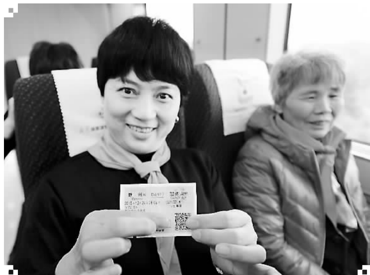
2015年12月26日，乘客在从赣州驶往福州的D6977次列车上展示自己的车票。

2015年6月，龙岩市旅游集散服务中心陆续开通11条旅游专线，为游客玩转龙岩提供极大便利。11月初，古武高速武平段全线建成通车；12月7日，武平旅游集散服务中心正式开业，推出3条便民旅游特色专线，长汀也实现“镇镇有干线”，此间历史文化名城周边旅游资源的通达性得到进一步增强。