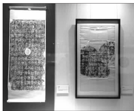
古今对比《琅琊台刻石》

当然最具看点的当属从国家图书馆26万余件金石拓片馆藏中选取的60余件宋元明清时期具有代表性的碑帖名品。几乎都是难得一见的珍品,吸引了大量的书法爱好者前来参观。