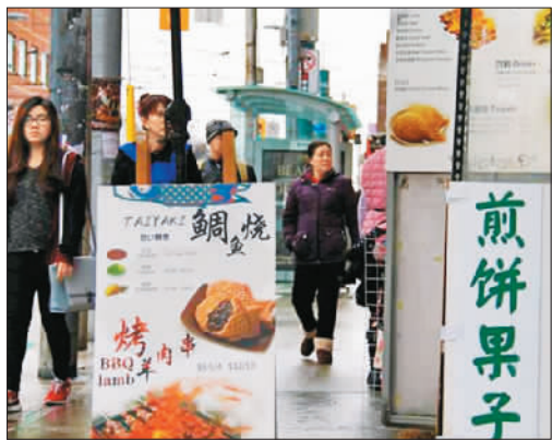
▲ 加拿大多伦多唐人街的小吃店。

“中国特色小吃融入西方世界的同时也是它不断改变、拓宽版图的过程。”一位移居美国多年的川菜一级厨师这样说道。