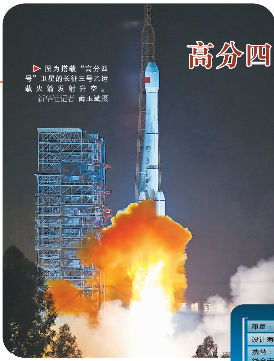
▶ 图为搭载“高分四号”卫星的长征三号乙运载火箭发射升空。