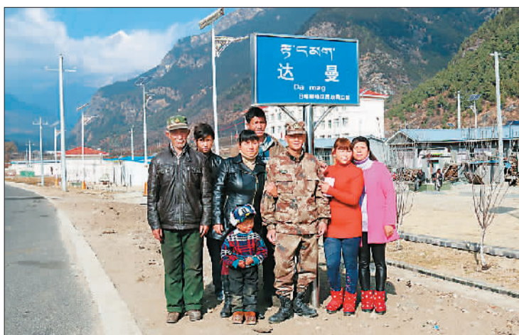
▲ 村民们在村口合影。

以前，达曼村里的年轻人基本没有上过学，甚至包括村长在内的绝大多数成年人不会写自己的名字。如今达曼村的适龄儿童全部都在接受教育，同样享受藏族学生的“三包政策”。目前，已有40多名达曼学生在小学、中学就读。