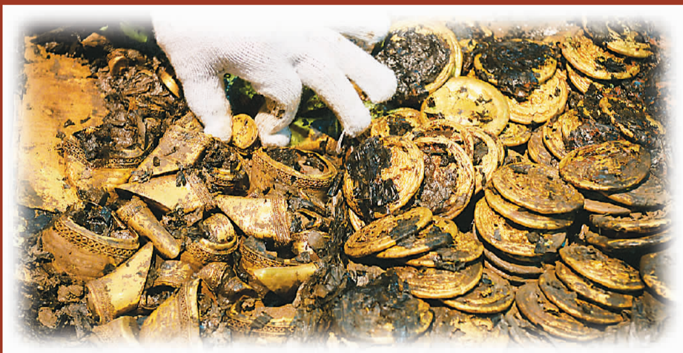
海昏侯墓主棺出土的马蹄金器、金板和金饼。

新华社南昌12月25日电（记者袁慧晶、万象）继以285枚金饼创下“汉代考古之最”后，海昏侯墓再次出土了33枚马蹄金、15枚麟趾金以及20块金板，整个墓葬中出土的金器数量已达378件。专家称，这一发现佐证了西汉时期黄金储备惊人的文献记载，还有待解之谜。