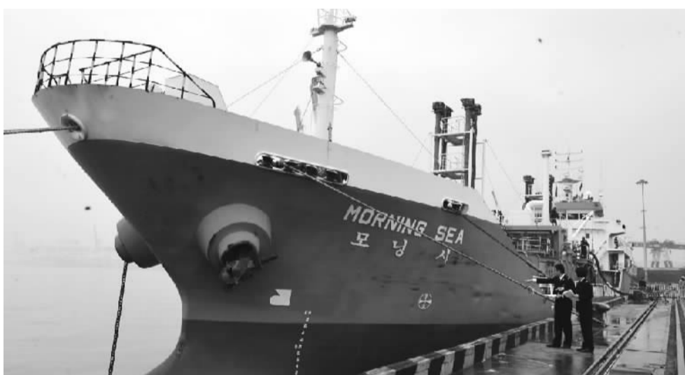
青岛海关关员现场监卸首票进口货物液体硫磺。