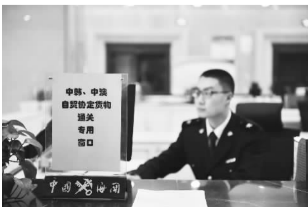
青岛海关中韩、中澳自贸协定货物通关专用窗口。

作为东北亚国际航运中心，中韩自贸协定对港口经济及港口辐射能力提升影响深远。青岛港与釜山港互为友好港口，青岛市在釜山设立青岛工商中心的工作也正逐步推进。韩国企业商品通过青岛多式联运海关监管中心，可以更方便地通达欧洲和东南亚。同时，伴随着这样的开放新优势，青岛大力发展转口贸易，在港口运输、建设现代物流中心等方面与韩国进入合作的新高度。商务部表示支持将青岛中韩产业园建设列入中韩经贸联委会重要议题。