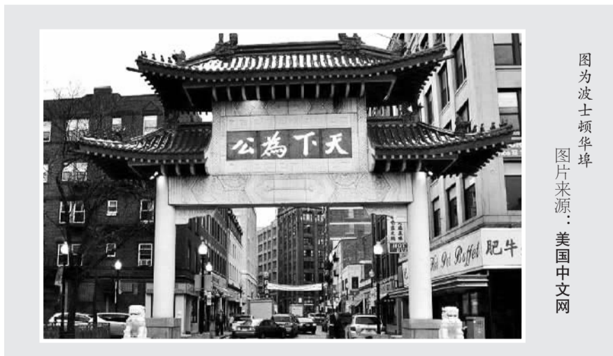
图为波士顿华埠。

“前来投资的商人大多从利益出发，只要获得了政府的批准，就能够随意改建，不会在意是否保留了唐人街原有的面貌。”美