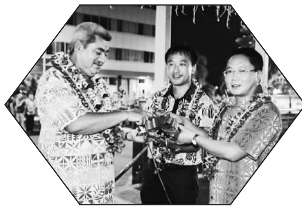
图为萨摩亚副总理福诺托(左一)、中国驻萨大使王雪峰(右一)和华人企业家共同点亮新年彩灯。