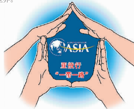
亚洲新未来 韩鹤松作