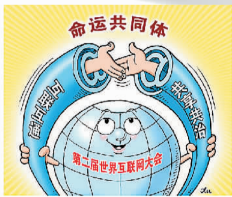
共建 徐骏作

当专机进入巴方领空时，8架“枭龙”战机起飞并全程护航；当习近平主席步出飞机舱门时，机场鸣放21响礼炮表示最高的敬意。时间回到2015年4月20日，这是习近平主席抵达巴基斯坦进行国事访问时的场景。习主席的年度首次出访，就获得了巴基斯坦这位老朋友的高规格礼遇。