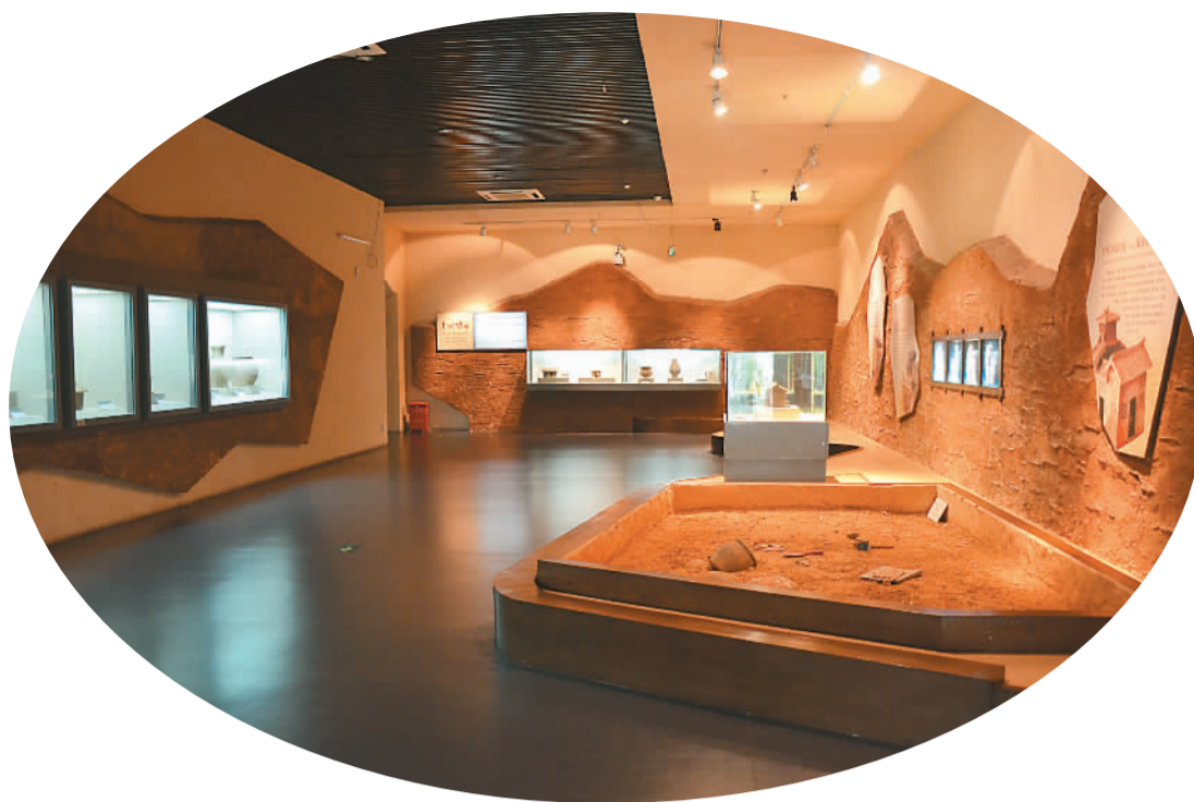
「瓯骆遗粹」展览中模拟的文物出土场景

先秦时期，广西为百越之地，早在80万年前的旧石器时代早期，就有人类在此劳作生息。秦始皇为统一岭南，开凿灵渠，连接长江与珠江水系，此后，广西与中原地区的交流日益密切。在悠久的历史中，人类在百越地区留下了哪些宝贵遗迹？八桂大地的民族文化瑰宝如何代代相传？历朝历代有多少艺术珍品得以留存？近代历史上，壮乡涌现出哪些杰出人物？……这些问题都可以在广西博物馆找到答案。