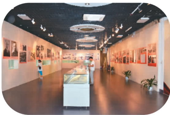
「广西人的抗战」展厅

当发生过的一切随着时间尘埃落定，历史展览可以追忆一个民族、一个国家的发展历程，记忆一片土地曾经经历的轰轰烈烈与辉煌不凡。