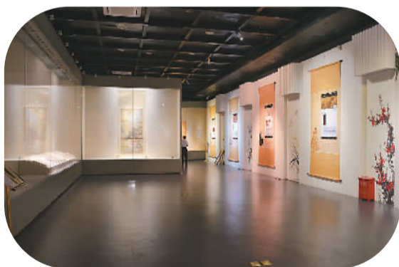
明清人物画像展厅，右侧墙上挂着的卷轴为博物馆精心设计的“画家朋友圈互动”场景。

广西有壮族、苗族、瑶族等多个少数民族。在广西博物馆内，一座占地2.4万平方米的民族文物苑，将散居各地的少数民族民居建筑汇集在一起，文物苑成为了独具地方性特色的民族文物露天陈列馆。