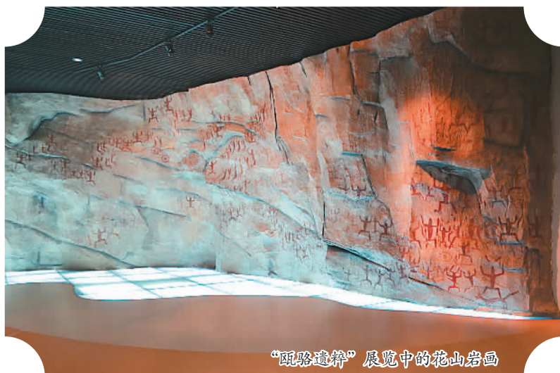
「瓯骆遗粹」展览中的花山岩画

此外，参观者可以亲身体验酿酒等工艺，与表演者互动，还可选购民族工艺品，品尝各式各样的民族风味小吃。这些有声有色、有滋有味的活动，让民族历史文化变得生动具体，人们在体验与互动的过程中，对广西传统民俗风情有了更加直观的感受。