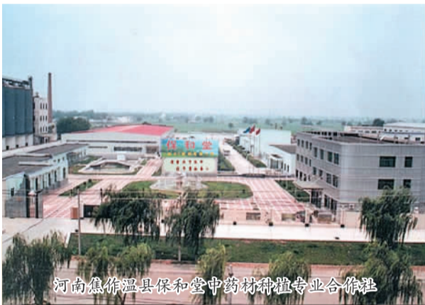
河南焦作温县保和堂中药材种植专业合作联社