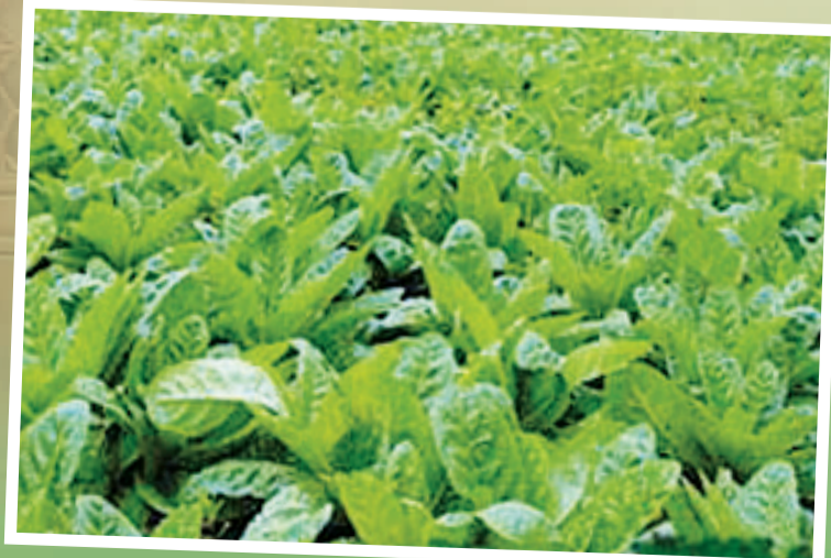
保和堂的怀地黄种植基地