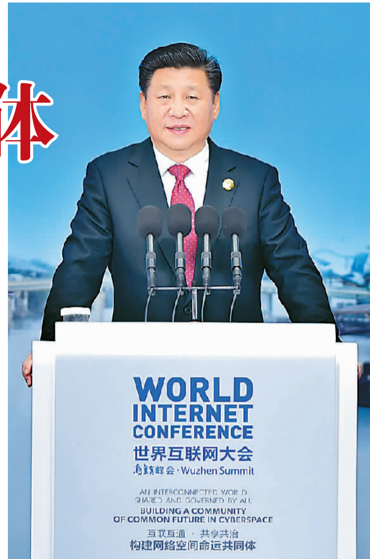
上图: 习近平发表主旨演讲。 下图: 习近平与会嘉宾集体合影。