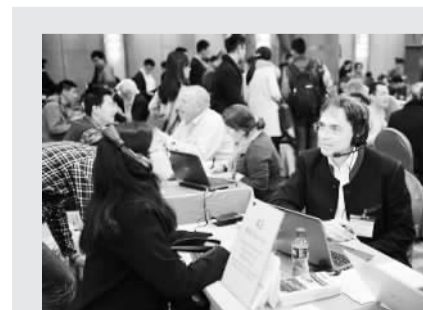
图为2015年博士生教育国际交流会场。

本报电 由中国教育国际交流协会主办的博士生教育国际交流会日前在京召开。来自澳大利亚、比利时、加拿大等12个国家的近80所世界一流研究型大学、博士研究生学院、实验室和研究中心参会。