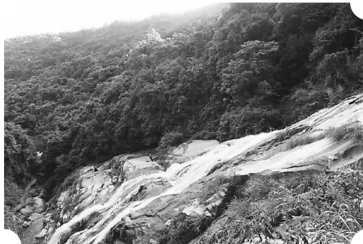
武平梁野山景区通天瀑布群