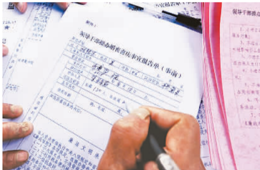
江西鄱阳：签订“承诺书”规范“升学宴”。