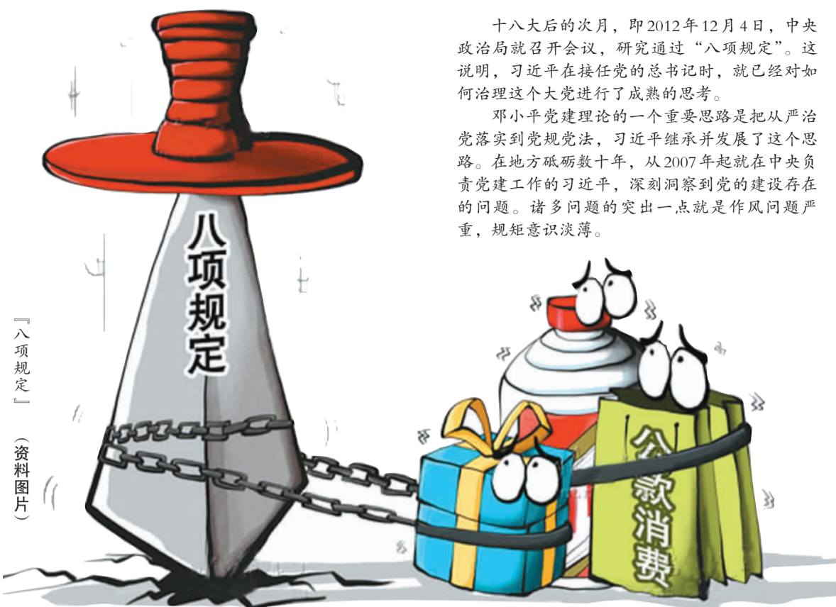
「八项规定」(资料图片)