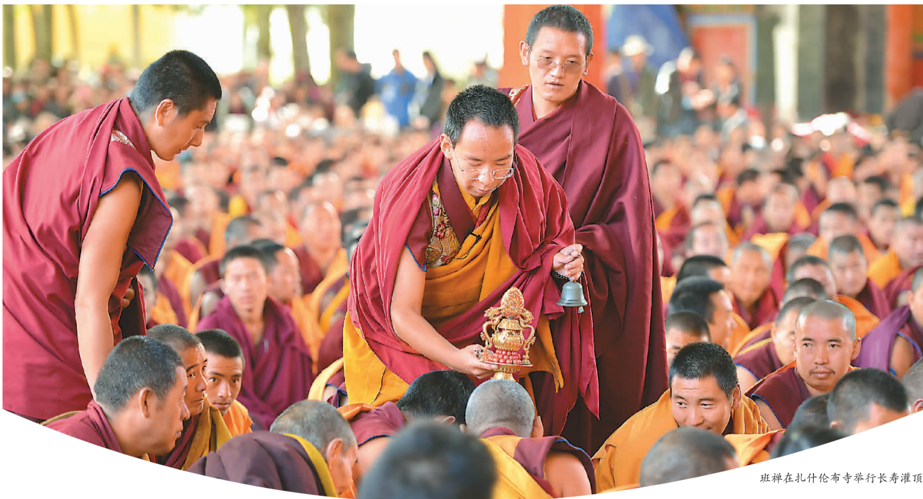
班禅在扎什伦布寺举行长寿灌顶。