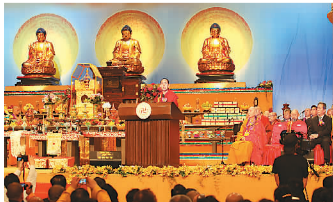
2012年，班禅在第三届世界佛教论坛上演讲。

班禅喜爱运动，经常和身边的工作人员一起打篮球。闲暇时，他也会用手机上网，或是玩一些电脑游戏，甚至尝试过网购。这时，大家看到的，十足就是一个充满活力的“90后”青年。