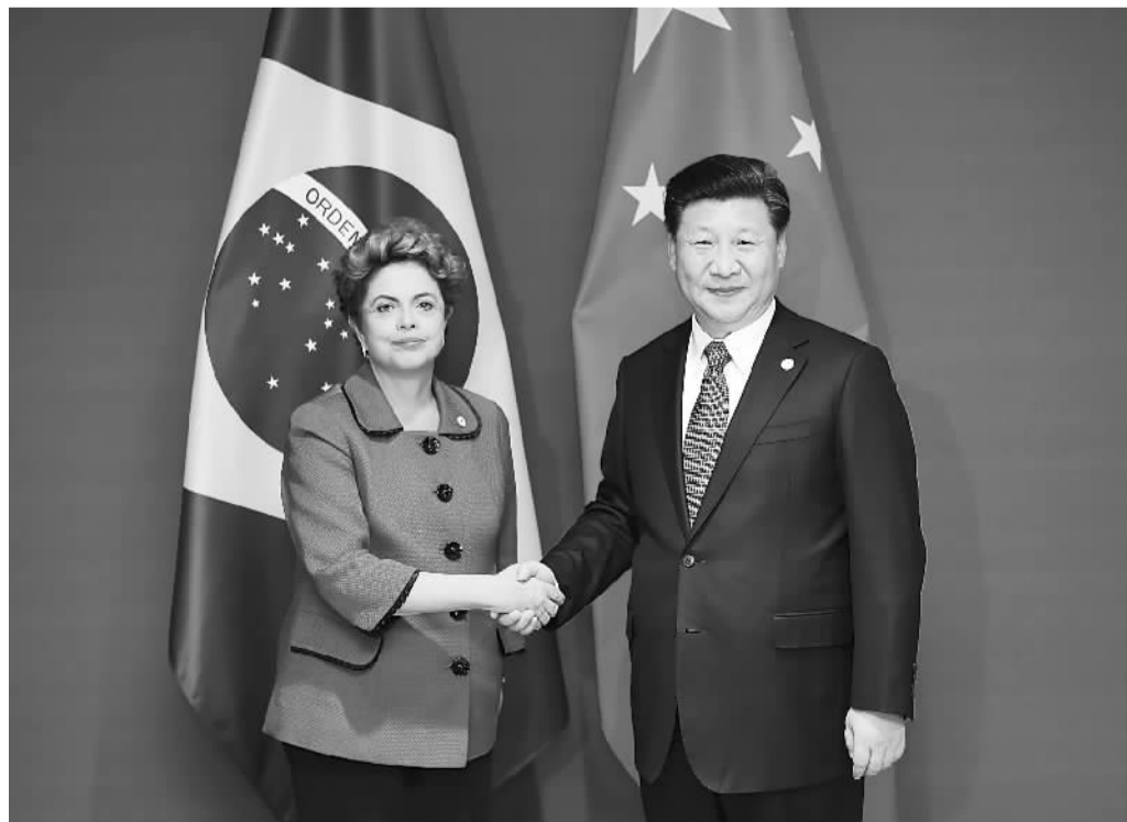
11月30日，国家主席习近平在巴黎会见巴西总统罗塞夫。

在气候变化问题上拥有相似的历史背景和共同利益。巴方愿同中方在气候变化巴黎大会期间加强协调合作，推动各方根据共同但有区别的