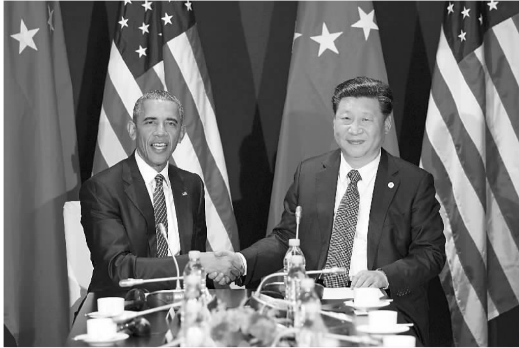
11月30日，国家主席习近平在巴黎会见美国总统奥巴马。

习近平指出，中美要尊重彼此核心利益和重大关切，坚持通过对话磋商妥善处理分歧。关于台湾问题，习近平指出，维护台海和平稳定，符合中美共同利益。希望美方以实际行动支持两岸关系和平发展。关于网络问题，习近平指出，双方要相向而行，展示诚意，共同推动相关对话取得积极成果。我们也愿同包括美方在内的国际社会一道，推动制定网络空间国际