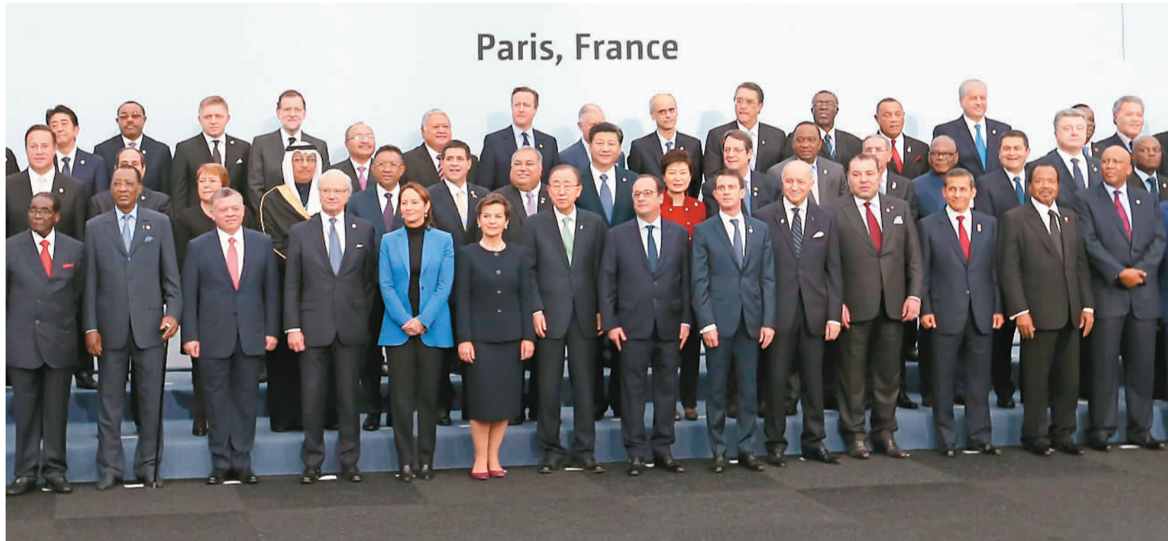
11月30日, 国家主席习近平出席气候变化巴黎大会开幕式并发表重要讲话。图为与会领导人合影。

约150个国家领导人出席气候变化巴黎大会开幕活动。与会领导人表示, 气候变化问题是全人类面临的共同挑战, 攸关人类未来, 需要各方携手应对。气候变化巴黎大会为全球共同应对气候变化提供了重要契机。巴黎大会要取得成功, 就要确保大会达成全面、均衡、有力度、有约束力的协议。各国要加大对清洁能源、低碳经济等领域的投资, 制定有雄心的减排计划, 减缓气候变化过程。杨洁篪等出席会议。