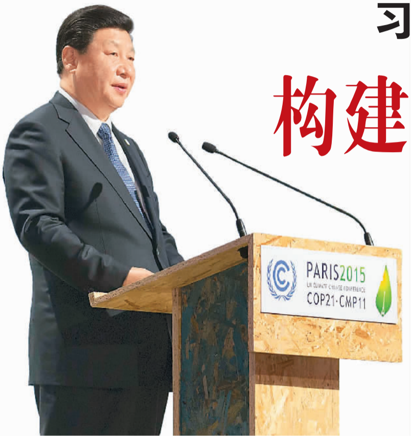
11月30日, 国家主席习近平出席气候变化巴黎大会开幕式并发表重要讲话。