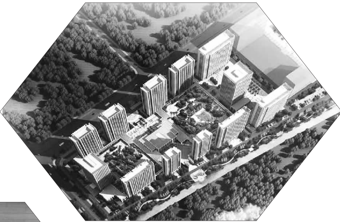
康老二期工程效果图

康老医疗旨在病有所医、老有所养。中国医疗养老等民生改善任务迫在眉睫，迫切需要解决提高养老资源配置效率、实行精细化管理和提升服务质量等问题。所以康老医疗，其实是社会医疗保险制度和养老保险制度的并称。浙江康老总结调研客群对象，总体对医疗呈现以下四大特点：健康活跃，对医疗有要求；经济良好，支付能力强；养老要求高，注重生活环境；现代观念强，候鸟式旅居；全龄养老；自理-介助-介护，持续照护。医疗旅游：候鸟式旅居生活，强势医疗资源。“CCRC”一养老不用搬家，为处于不同健康阶段的老年人，定制持续的专业健康管理、照护服务。CCRC的组成及照护模式：独立生活区；协助生活护理区（部分社区拥有老年痴呆失忆护理照护专区）；专业护士护理（部分社区含康复服务）。