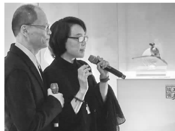
台湾艺术家、台湾琉璃工房创始人张毅和杨惠姗夫妇28日携《弥陀佛》、《千手千眼千悲智》和《且舞春风共从容》等琉璃艺术精品在青岛办展，向参观者传递佛教的慈悲与智慧。图为张毅和杨惠姗介绍作品《翠鸟》。