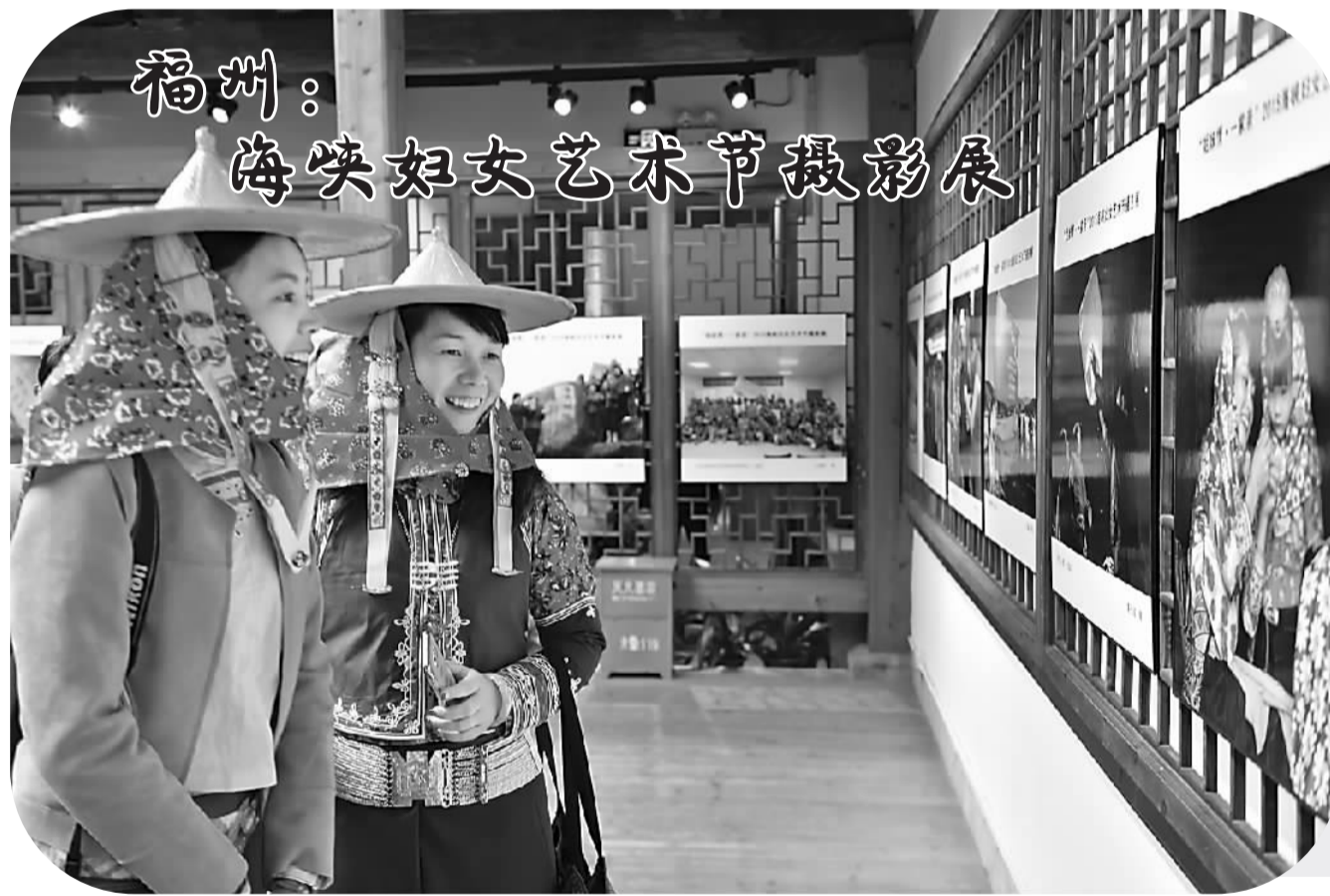
福州：海峡妇女艺术节摄影展

《内地与澳门关于建立更紧密经贸关系的安排》于2003年签署，自2004年全面实施。