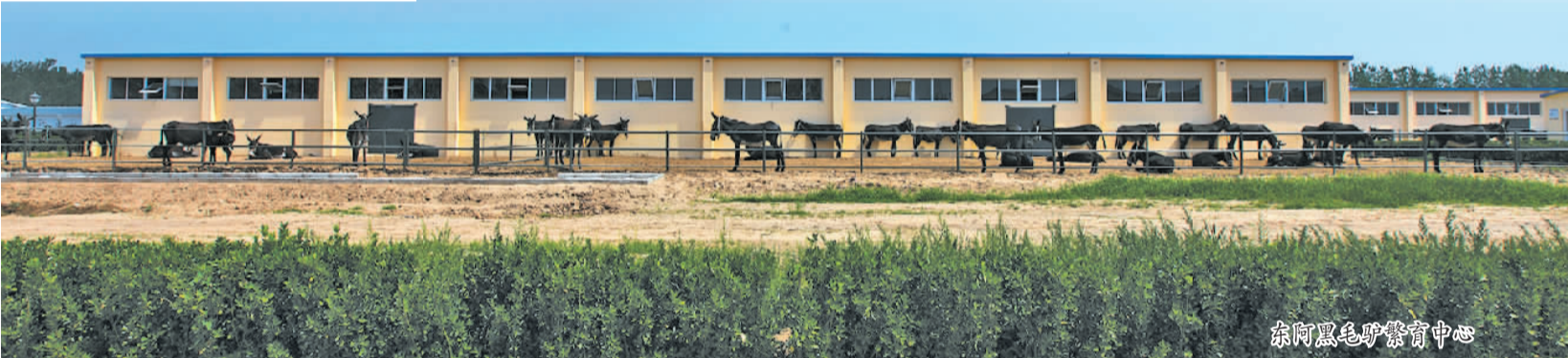
东阿黑毛驴繁育中心

正如阿胶专业委员会管理办法中约定的那样,“在中国中药协会领导下,进一步更好建立行业规范,推动行业转调升级,带动行业发展,适应大健康发展趋势,创建阿胶行业和谐发展