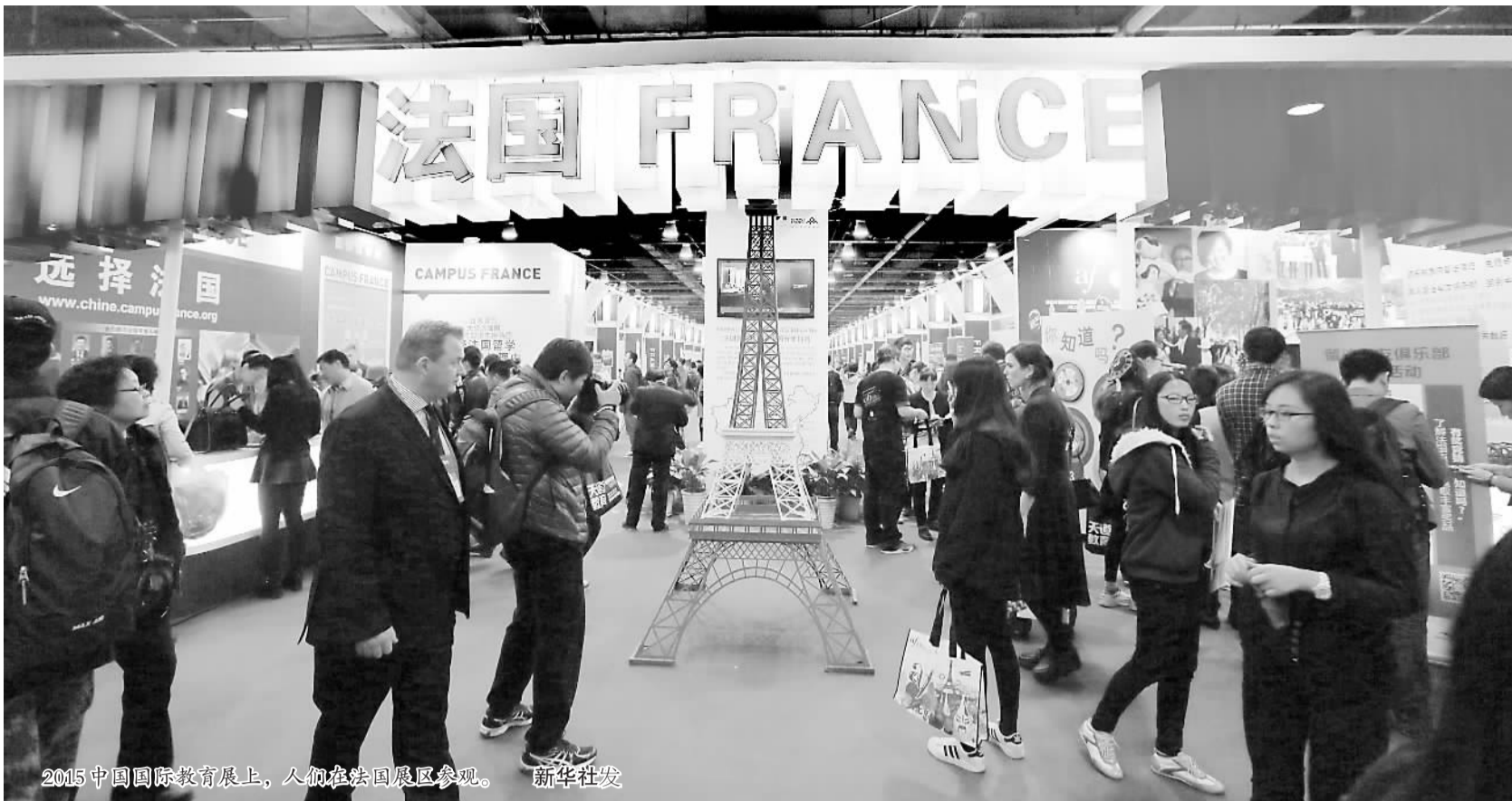
2015中国国际教育展上，人们在法国展区参观。