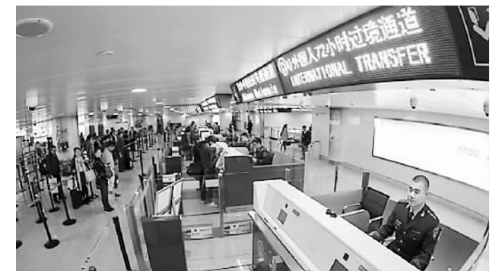
青岛机场外国人72小时过境通道

（注：免签期间活动范围限于山东省行政区域，政策适用国家名单按照最新补充修订的51个国家人员的范围执行。）