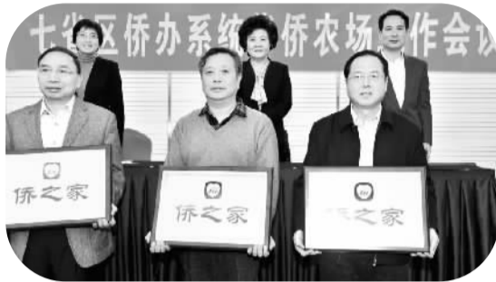
图为国务院侨办主任裘援平（后排中）、副主任谭天星（后排右）等为首批“侨之家”授牌。

广东省侨办等单位分别汇报了本地华侨农场改革工作情况。随后还举行了华侨农场社区“侨之家”揭牌仪式。