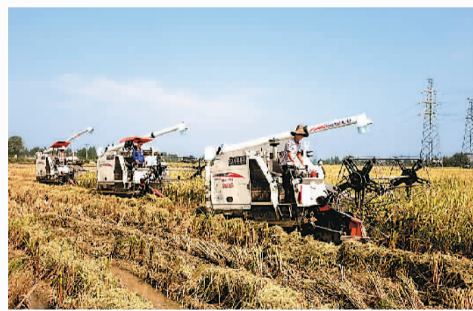
成都的农业机械化作业

“每到3月，我们崇州的油菜花就会开得很灿烂，吸引了大量游客的观赏。尤其是油菜花节期间，每天的人流量达到上千。所以我们就选择在油菜地里开辟出一些观光区，只需3平方米就可以支一把阳伞，摆一张茶桌。这里的附加值大大超过同样面积油菜花所能带来的利润。”崇州市有关部门负责人表示，除了观赏油菜花，在园区采摘草莓、葡萄同样是很火爆的农村休闲游。这种与自然亲密接触的郊游方式正吸引着越来越多居住在城区的成都人。