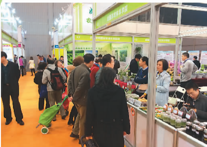
农博会上的观众

在奋力打造西部经济核心增长极，加快建设现代化国际化大都市的同时，农业不是成都发展的包袱，反而是开垦的沃土。规模农业、品牌农业、生态农业、双创农业和幸福农业，这就是成都打造国际都市现代农业的目标。