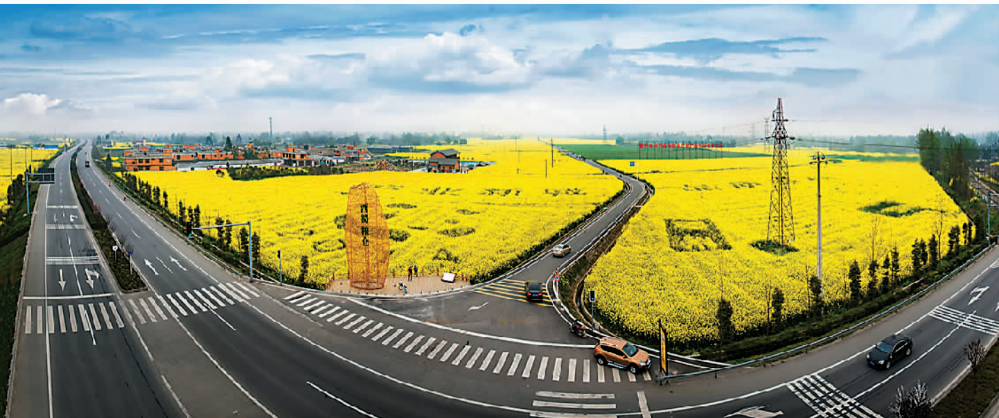
崇州市隆兴镇黎坝村的田园花海

提升了作业效率，合作社便更有能力来实现产业链的拓展和收益的提升。比如青桥村开设了烘储中心，为其他村产出的水稻、小麦、油菜籽等作物进行烘干作业，从而收取作业费；开设了草莓基地、葡萄基地、油菜地里的休闲中心，发展起了第三产业的乡村旅游。另外，他们还实行了“鱼稻共生”的模式，让鱼在稻田捕食害虫、提供有机肥。这种做法既能保证稻米的绿色环保，又能通过养