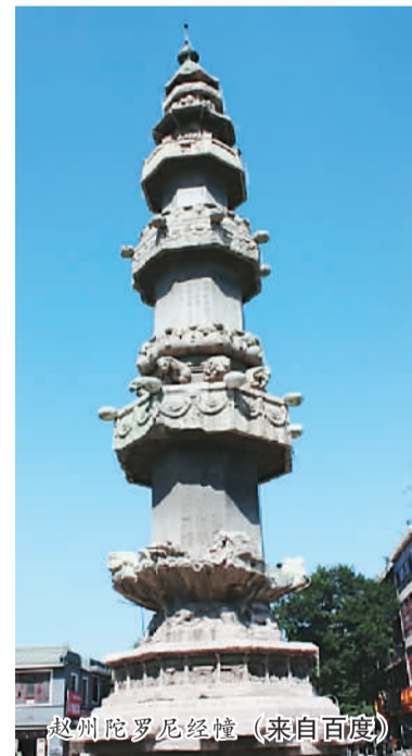
赵州陀罗尼经幢