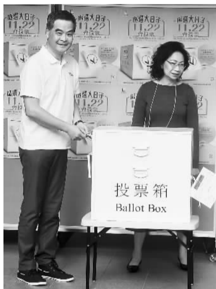
图为十一月二十二日,香港特区政府区长官梁振英与夫人梁唐青仪在港岛半山选区的票站投票,选举区议员。

当上区议员之后,除了能更有效地服务社区之外,区议员还有一笔可观的薪金。根据香港立法会文件,第五届区议员由2016年1月1日起,每月薪金增加15%,由25760元提升至29620元;并增设一项拨款,用来支付区议员的外访开支,每名议员每届任期上限为一万元;另外,每名区议员还可获得每年最多45.6万元的营运开支“实报实销”款项,用来支付办公地方的开支、助理薪酬、审计费用、印刷费和宣传物品开支、通讯费、家具及设备的相关维修保养等。