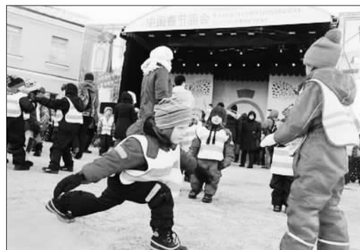
在芬兰赫尔辛基举办的中国春节庙会上,芬兰小孩模仿中国武术表演。