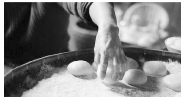
十月朝，糍粑碌碌烧

等7—15天后，用棕叶绳索串挂起来，滴干水，进行加工制作。选用柏树枝、甘蔗皮、椿树皮或柴草火慢慢熏烤，然后挂起来用烟火慢慢熏干而成。或挂于烧柴火的灶头顶上，或吊于烧柴火的烤火炉上空，利用烟火慢慢熏干。