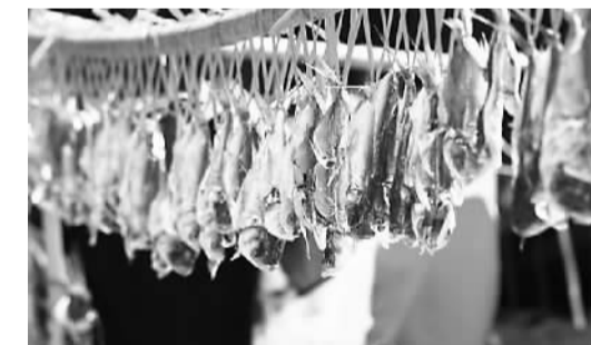
小雪时，台湾中南部的渔民们开始晒鱼干

糍粑由糯米蒸熟再通过特质石材凹槽冲打而成，手工打糍粑很费力，但是做出来的糍粑柔软细腻，味道极佳。有纯糯米做的，也有小米做的，也有糯米与小米拌和做的，还有玉米与糯米拌和打成的。此外，还用黏米与糯米磨