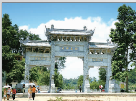
广西最大的佛寺——四恩寺

千年梧州，有着奋发向上的朝气，有着海纳百川的胸怀。在这片充满活力和机遇的土地上，“绿城水都”的绝代韵味等待您来品味，“百年商埠”的辉煌复兴等待您来见证，“长寿之乡”的美好生活等待您来分享。（吴萱）