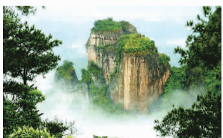
丹霞胜景——太平狮山

纵向发展的休闲养生旅游带。“四区”：以长洲水利枢纽库区水体旅游资源和藤县西江水岸为依托，打造西江黄金水道标志性景区；以蒙山县为龙头整合北部“文化古城、生态养生”旅游资源，打造北部休闲古城旅游区；以建设天龙顶山地休闲旅游度假区为重点，打造南部山地休闲旅游区；以“茶文化”为主题，深入挖掘六堡茶文化底蕴，建设六堡茶文化生态旅游区