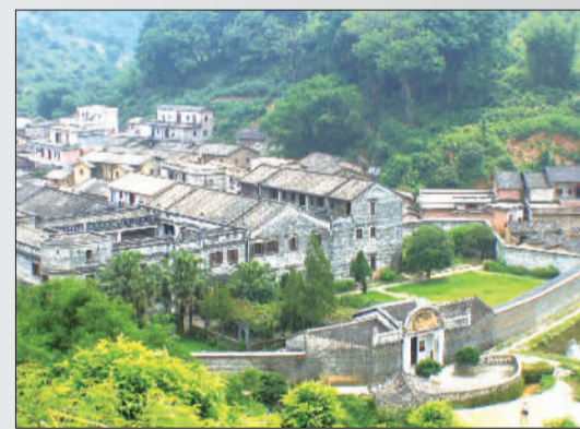
名人故里——李济深故居，全国重点文物保护单位。故居建筑充分体现了中国传统阴阳八卦文化，是海内外游客仰慕之圣地。