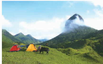
休闲天龙顶——蓝天、白云、草甸构成一幅令人心旷神怡的自然景观，让人流连忘返。

梧州有许多全国和世界之“最”。梧州是世界最大的人工宝石加工基地，全国总量的80%、世界总量的70%的人工宝石在这里加工，然后销往世界各地；有亚洲最大的黑叶猴人工繁殖基地，人工繁殖的黑叶猴已经超过100头，其中两头赠送澳门市政厅；是中国最大的松脂生产基地，