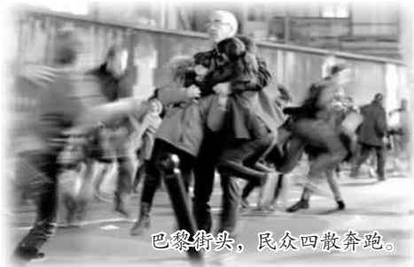
巴黎街头，民众四散奔跑。

发生在巴黎的一系列恐怖袭击牵动人心。一个星期过后，身处海外的华侨华人，工作与生活受到了怎样的影响？亲历惊魂时刻后，他们又有怎样的感受与思考？连日来，海外华媒对此给予了持续关注和报道。