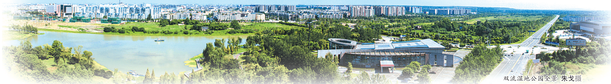
双流湿地公园全景