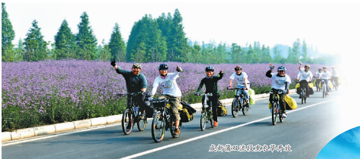
成新蒲双流段薰衣草开放