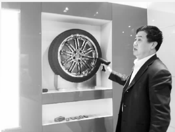
青岛软控集团生产出信息可追溯的轮胎

据了解，“中韩快线”班列的开通，使广东地区的出口货物4天就可抵达韩国，出口韩国的机械设备、纺织品、服装鞋帽、小家电、小商品，进口至广东的液晶显示器、韩国元器件、日化用品等实现了公交快捷运输。