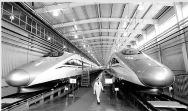
青岛轨道交通千亿级产业链加速崛起

日前，海尔研发的世界上首台3D打印空调惊艳亮相柏林国际电子消费品展览会；武船重工建成世界第一艘具备3000米级深水铺管能力、4000吨级起重能力的“海洋石油201”号深水铺管起重船。