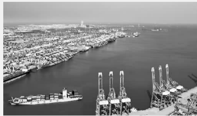
青岛前湾港新港区鸟瞰