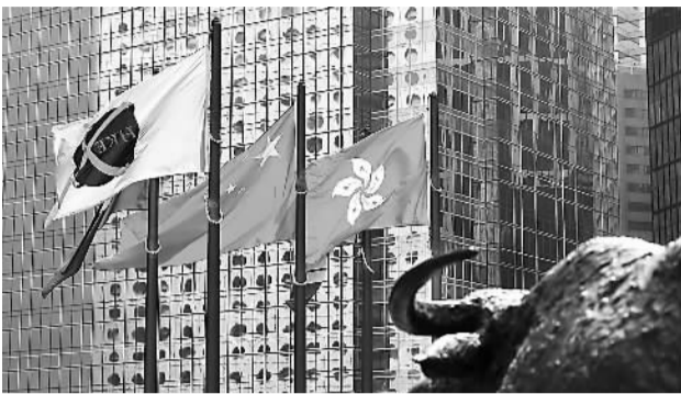
17日,国旗、香港特别行政区旗和香港交易所标识旗飘扬在香港中环交易广场。

11月17日,沪港通满一周岁。1年前,人们对这个联通上海与香港股市的新生物心存疑虑,因为两市不仅运行规则不同,连使用的货币都不一样,要在二者之间搭桥可不是件简单的事。这一年,沪港通交出了一份怎样的成绩单?