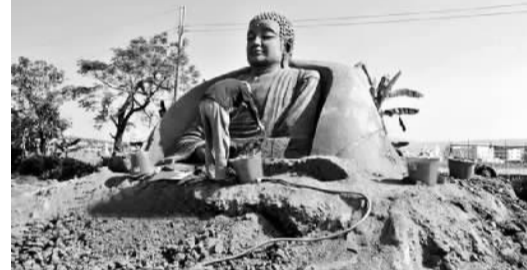
2015台湾泥雕艺术节将在高铁彰化站旁登场,10多件大型泥雕作品在彰化县田中镇展出。