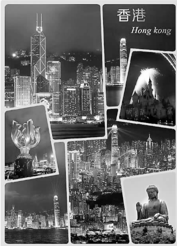
香港 Hong Kong

多数香港人都认同,“一带一路”必将为香港带来极大发展机遇。细究起来,哪些行业将分享到“一带一路”红利呢?本报记者近日采访了相关专家学者——