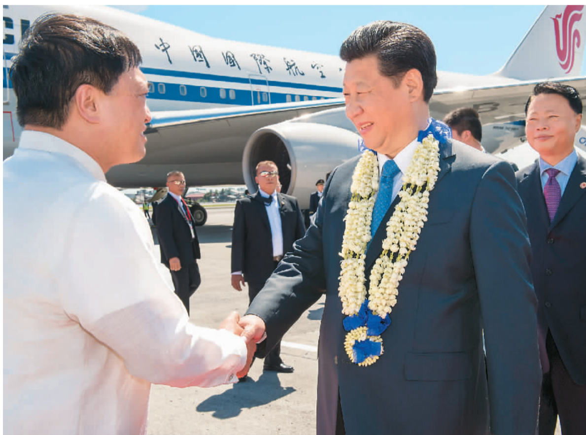
11月17日,国家主席习近平抵达菲律宾首都马尼拉尼诺·阿基诺国际机场,出席即将举行的亚太经合组织第二十三次领导人非正式会议。菲律宾高级官员到机场迎接习近平主席。

习近平是在结束出席二十国集团领导人第十次峰会后抵达马尼拉的。当地时间16日晚,习近平离开土耳其安塔利亚。土耳其经济部长泽伊贝克奇等政府高级官员到机场送行。