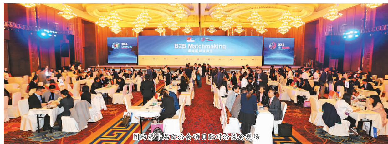
图为第十届欧洽会项目配对洽谈会现场