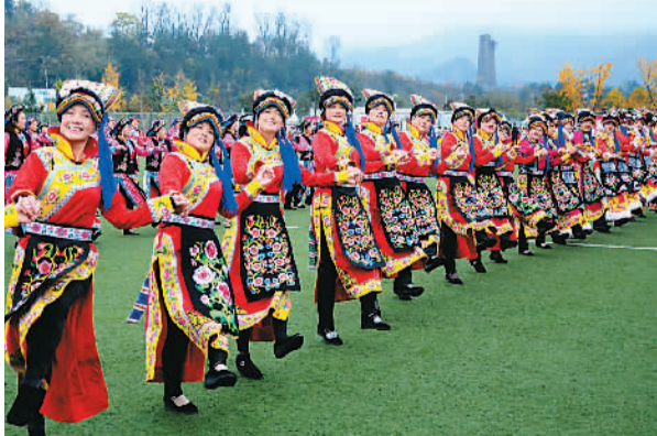
农历十月初一是羌历新年。11月11日上午,位于汉江源头的陕西省宁强县体育场内,万余人齐聚于此载歌载舞,共同庆祝羌历新年。