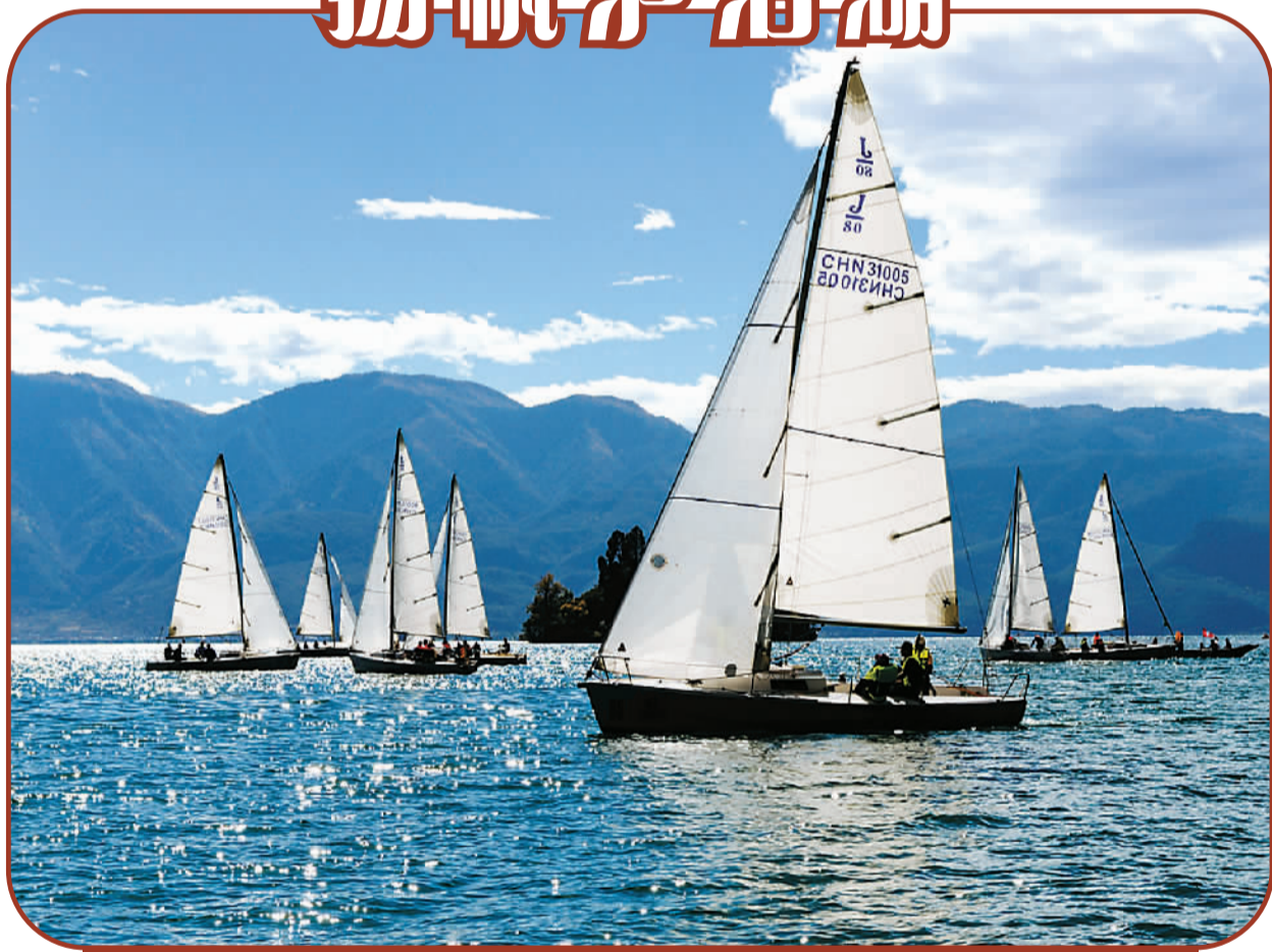
11月11日,2015中国四川盐源泸沽湖国际帆船巡回赛开赛,来自国内外的10支帆船队参赛。此次比赛为期两天,参赛船只只采用J80比赛用船,全部拆掉发动机,以自然风为动力。图为参赛船只在比赛中。