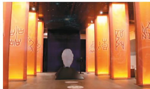
甲骨文记忆展中的互动设施

在甲骨文记忆展中，多媒体技术和丰富的互动手段，拉近了观众与文字的距离。在展厅入口处，现代化的声光电技术布置出栩栩如生的占卜场景，参观者只需动动手，就能体验甲骨占卜的