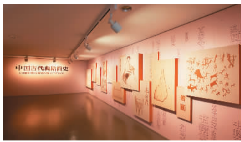
“中国古代典籍简史”展厅入口

罕见的刻辞人头骨、保存较完好的龟腹甲、甲骨文研究史上的代表著作……走进国家典籍博物馆，今年的年度大展之一——甲骨文记忆展正在举行。从3万多件甲骨中精挑细选的