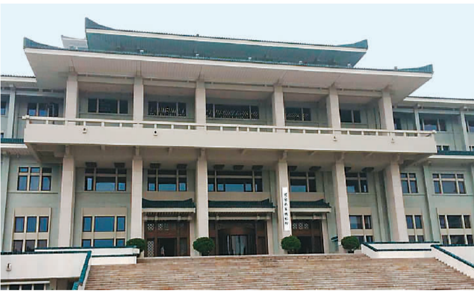
国家典籍博物馆外景