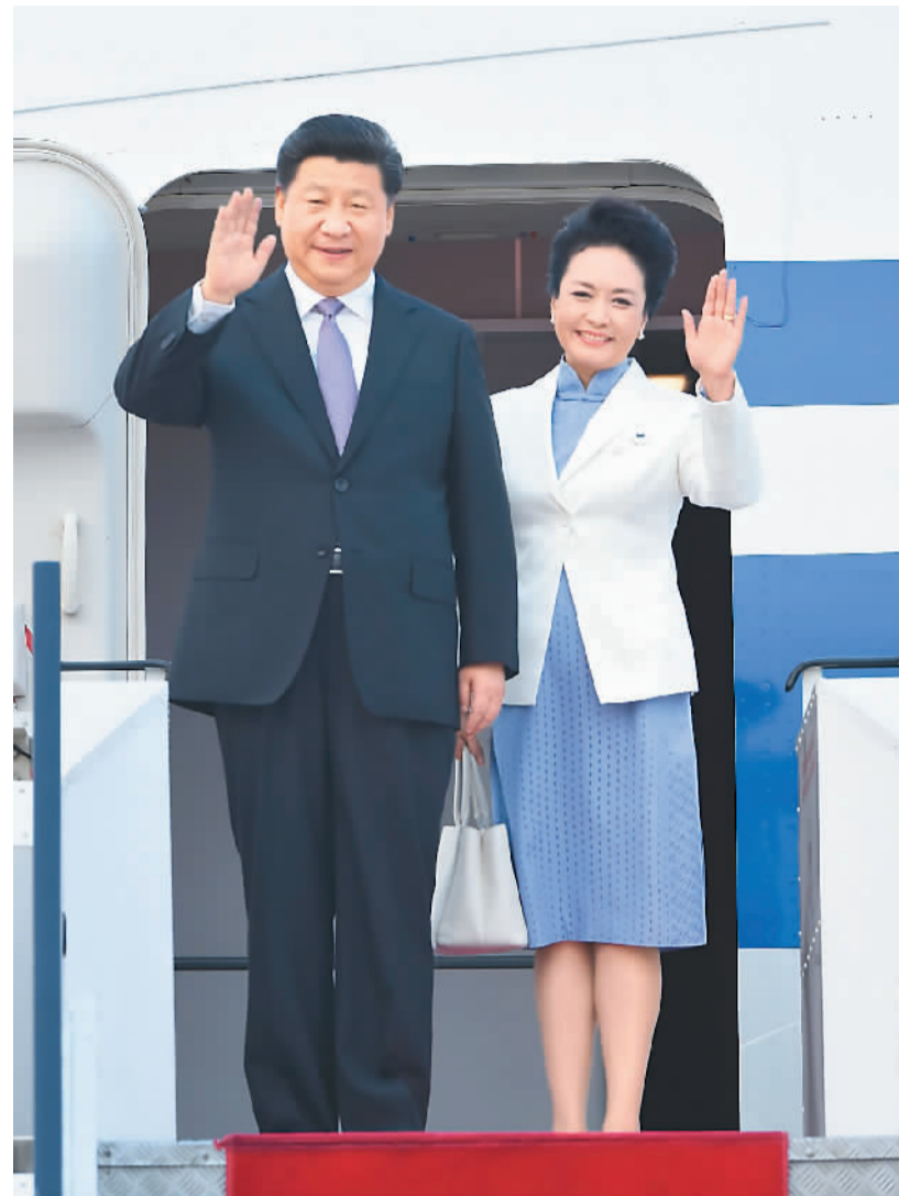
右图: 11月6日, 国家主席习近平抵达新加坡, 开始对新加坡进行国事访问。图为习近平和夫人彭丽媛向欢迎人群挥手致意。新华社记者 张铎摄

育人文、社会治理等各领域交流合作, 推动两国务实合作向纵深发展。三是加强在地区和国际事务中的协调和配合。新加坡今年接任中国—东盟关系协调国。中方愿同新方一道, 聚焦发展合作, 共同构建中国—东盟命运共同体。中新双方可以在联合国、亚太经合组织等国际和地区机制中的沟通协调。