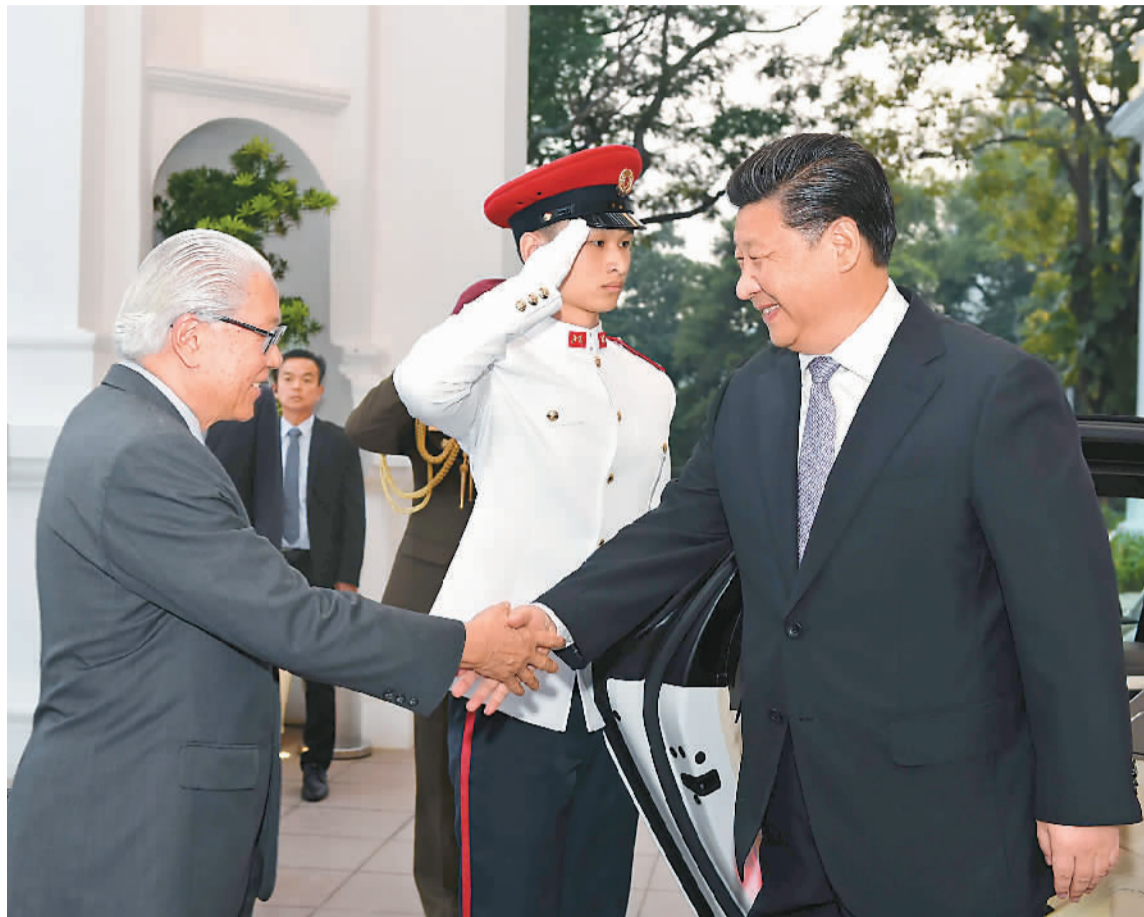
上图: 11月6日下午, 国家主席习近平在新加坡总统府会见新加坡总统陈庆炎。