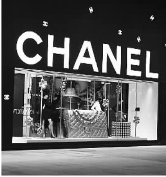
据新华社香港11月3日电 香港特区政府统计处3日发表最新数字显示,2015年9月零售业总销货价值的临时估计为352亿港元,同比下跌6.4%。

据统计,扣除期间价格变动后,2015年9月香港零售业总销货数量同比下跌3.1%、8月零售业总销货数量同比下跌幅度为0.1%。其中珠宝首饰、钟表及名贵礼物的销货价值同比下跌22.9%,服装销货价值同比下跌12.3%,鞋类、有关制品及其他衣物配件下跌7.0%。 特区政府发言人指出,展望未来,零售业短期内或仍将受制于访港旅游业的疲弱表现,也将取决于全球经济前景转差对香港经济及消费意欲的影响。政府会继续密切留意零售业务的表现及其对整体经济和就业市场的影响。 据新华社香港11月3日电 香港特区政府统计处3日发表最新数字显示,2015年9月零售业总销货价值的临时估计为352亿港元,同比下跌6.4%。