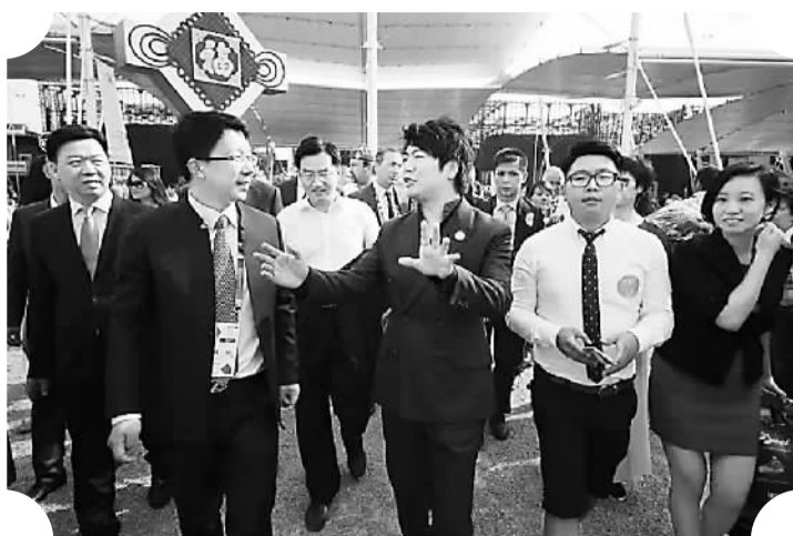
“聆听深圳——郎朗和他的城市”音乐会在米兰世博会