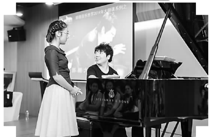
郎朗为孩子们授课