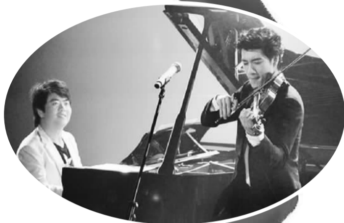
郎朗与王力宏在深圳音乐厅同台演奏，祝福大运会