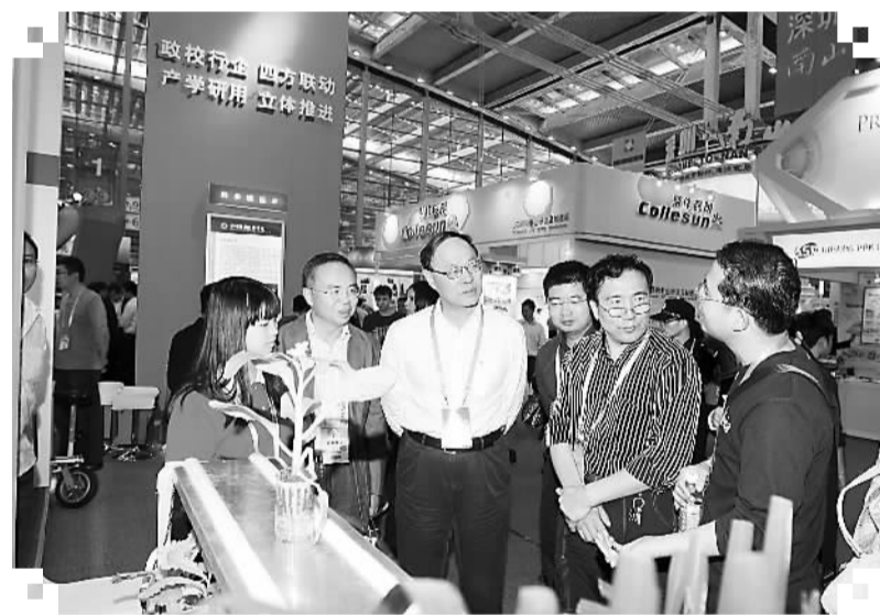
深职院应用研发成绩突出，每年都有师生科技创新产品亮相高交会

对于将深圳视为第二故乡的郎朗而言，他与深圳的故事还有很多。2012年7月4日，郎朗与深圳福田区签署了合作备忘录，郎朗国际音乐艺术学院和郎朗音乐工作室等多个项目将落户福田。全球首个以“郎朗”命名的国际性大型公益活动——“郎朗·深圳福田国际钢琴艺术节”是此次合作第一个落地项目。今年1月4日夜，2015首届“郎朗·深圳福田国际钢琴艺术节”拉开帷幕。在历时一周的时间里，举办了近30场的活动，包括音乐会、大师课、艺术讲座等。郎朗表示，该活动旨在将艺术节打造成具有国际水平的文化权威品牌项目，将钢琴精英赛举办成中国最具影响力、最权威、最专业、高水平的钢琴比赛之一。