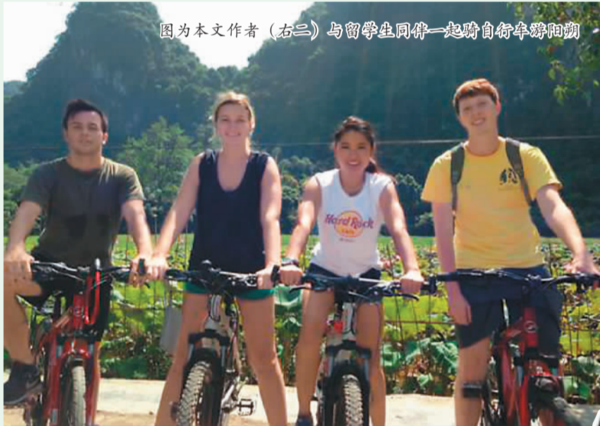
图为本文作者(右三)与留学生同伴一起骑自行车游阳朔