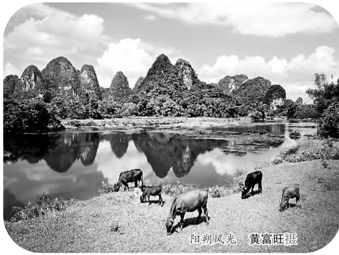
阳朔风光