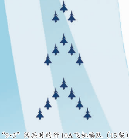
“9·3”阅兵时的歼10A飞机编队（15架）