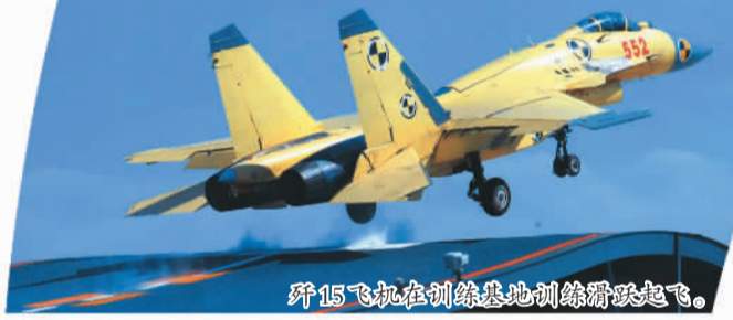
歼15飞机在训练基地训练滑跃起飞。