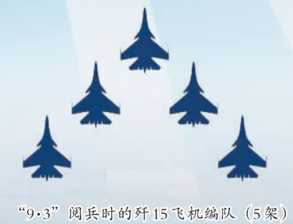
“9·3”阅兵时的歼15飞机编队（5架）