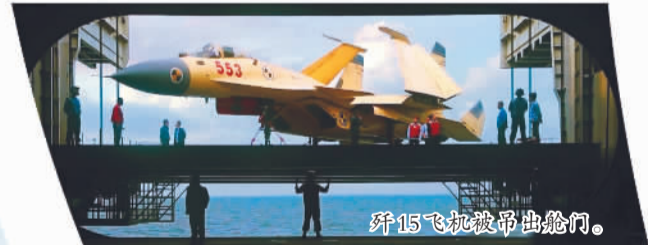
歼15飞机被吊出舱门。