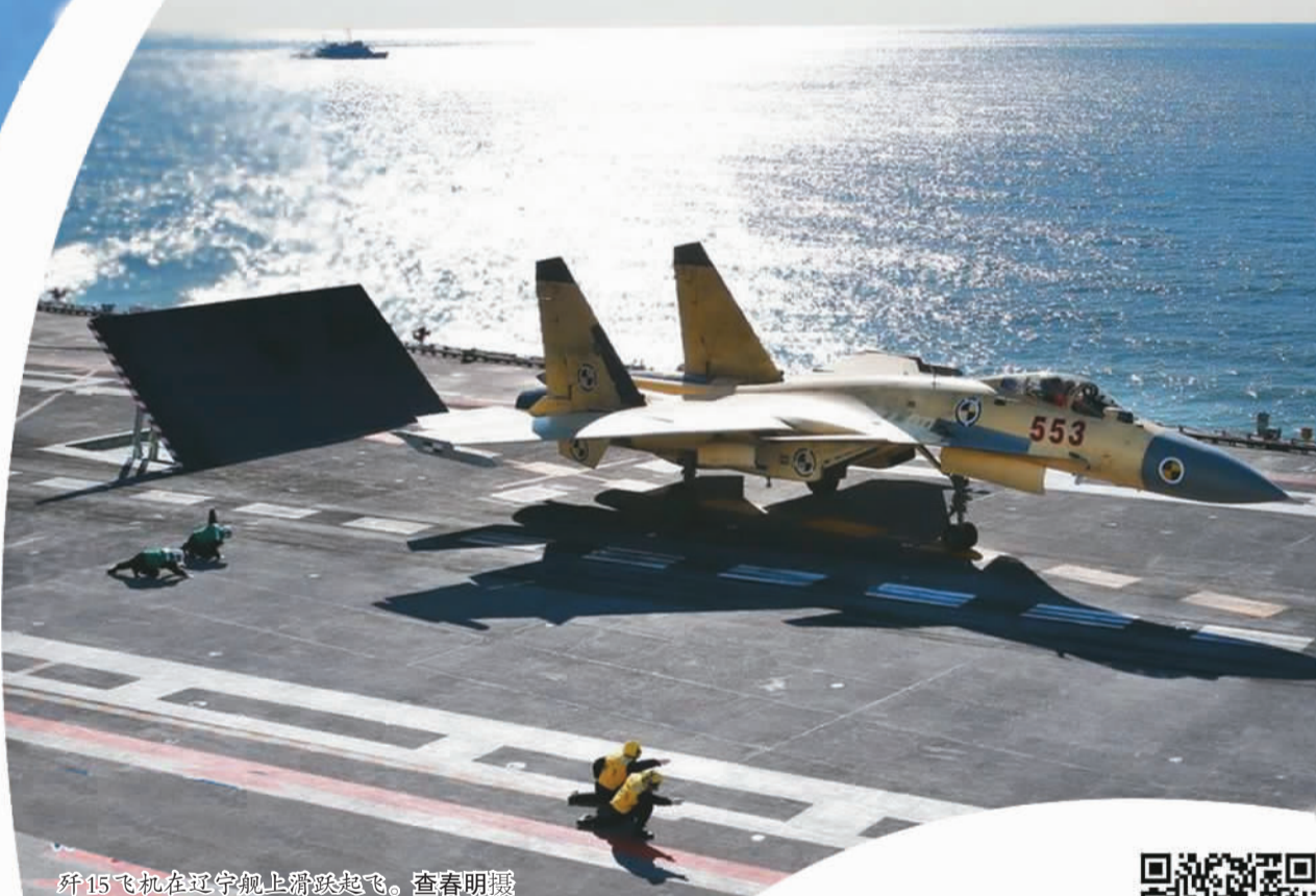
歼15飞机在辽宁舰上滑跃起飞。