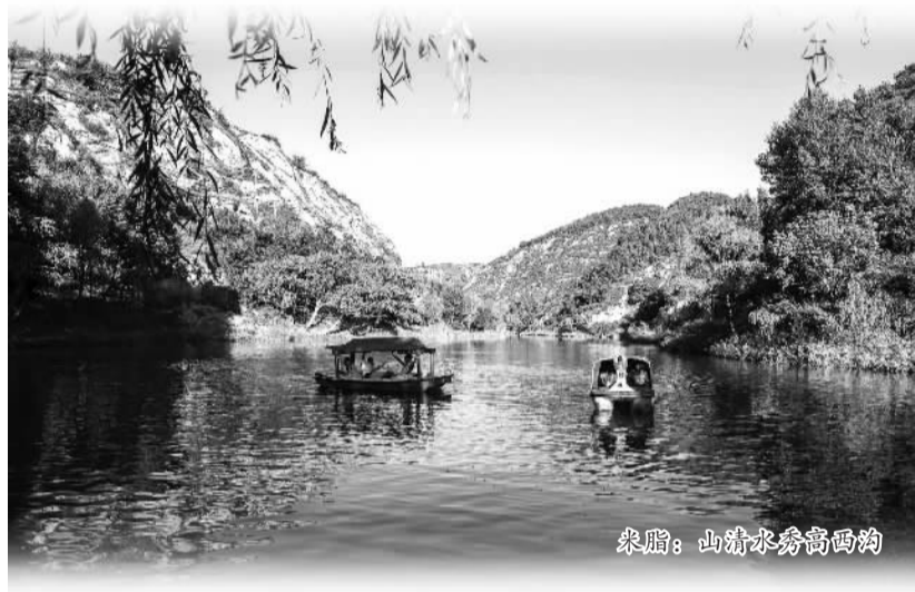
米脂：山水清秀高西沟

事。城乡区域协调发展、城乡居民收入水平不断提高、社会保障体系进一步完善、文化事业繁荣发展、社会大局和谐稳定……去年，榆林按照兜底补短原则，投入346亿元办好民生实事，人民日子越过越好，幸福指数越来越高。