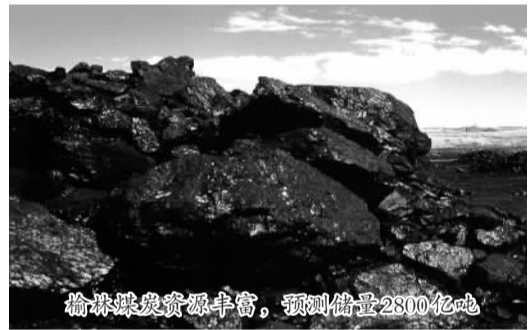
榆林煤炭资源丰富，预测储量2800亿吨

岩盐：预测储量6万亿吨，约占全国总储量26%，探明储量8854亿吨，盐层平均厚度达120米以上。主要分布在榆林、米脂、绥德、佳县、吴堡等地。