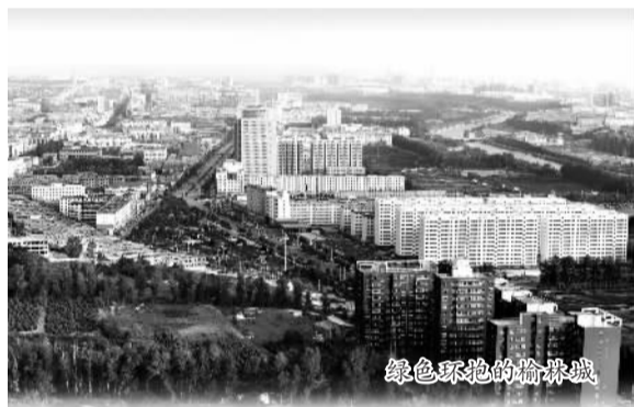
绿色环抱的榆林城

盛夏的榆林，桃红李白、满目葱茏。与自然景观交相辉映的，是这里火热的创新氛围：政府职能转变全面推进；科技成果转化成效显著；思路创新遍地开花……改革创新激发发展活力。榆林