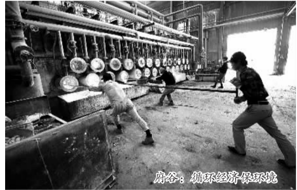
府谷：循环经济保环境

现代服务业加快发展。今年，榆林坚持将增加群众收入和培育新型消费业态作为扩大消费的着力点，大力发展与能化基地配套的城市经济和工业物流经济。在推动群众消费结构升级方面，榆林认真落实城乡居民收入与经济增长、财政收入增长联动机制，积极引导休闲、健康、养老、信用等消费新业态快速发展。在推进电子商务和信息消费方面，榆林着力加快推进电子商务公共信息服务平台建设，稳步推进榆横、神府、定靖、绥米四大物流园区建设，构建晋陕蒙宁毗邻地区物流枢纽。在旅游资源转化方面，榆林深入挖掘多元文化，发展壮大文化旅游产业，积极开展统万城遗址世界文化遗产申报和国家遗址公园建设工作，做好石峁遗址发掘和保护，加大白云山、红碱淖5A景区建设力度，统一规划建设王圪堵水利风景区，支持有关县区做好长城遗址、吴堡石城、波罗古堡、龙洲丹霞地貌等保护和开发工作，努力将潜在的旅游资源优势转化为现实的经济优势。