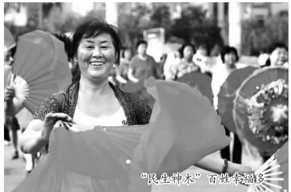
“民生神木”百姓幸福多

在空气质量方面，能源城市榆林交出了一份喜人的“气候答卷”。去年，城区二级以上天数达336天，