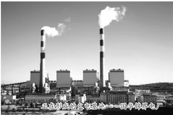
正在形成的火电基地——国华锦界电厂

商形势严峻等不利因素，榆林全市上下坚持“抓招商就是抓发展、抓项目就是抓转型”的理念，进一步创新招商方式。一方面，榆林招商部门主动出击，寻求商机，不断“走出去”让招商工作风生水起。另一方面，榆林毫不放松在“请进来”上努力，去年先后接待商务洽谈130批500多人次，为榆林全方位、宽领域、多渠道招商创造了条件，奠定了基础。思路创新让招商引资工作不断迈上新台阶。