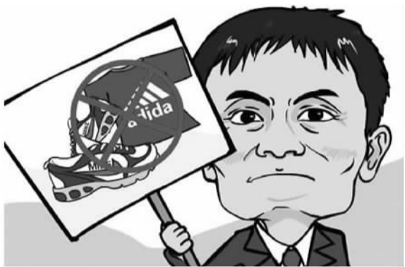
阿里巴巴与莆田联手推出“中国质造” 资料图片

莆田的产业转型经验同样值得关注。早在上世纪80年代，世界知名品牌耐克、阿迪达斯等便已将莆田作为代工工厂所在地，莆田由此掌握全球顶尖的造鞋工艺，并积累了丰富的经验。然而近来莆田制鞋业却深陷“仿冒”等口碑泥潭，甚至曾因高仿各类国际名牌鞋被扣上“假鞋之都”的帽子。