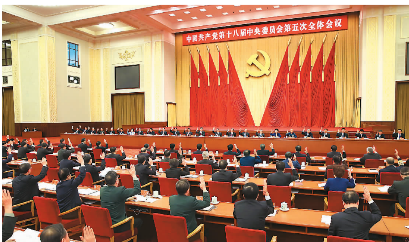
至二十九日在北京举行。中央政治局主持会议。